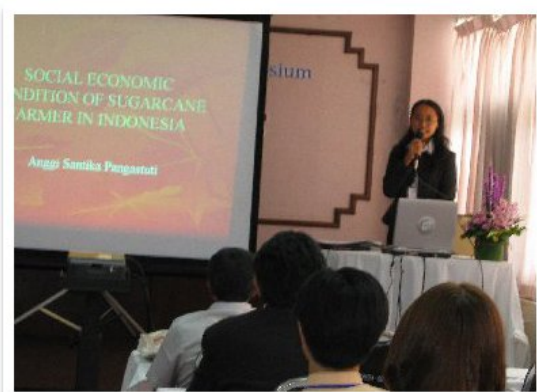
2004 年チェンマイ大学で開催された時の様子